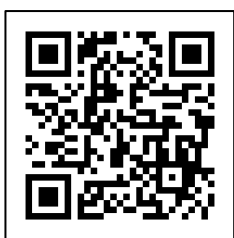
一回体験可能教室一覧

武道場を発着点として江南健幸ライドのコース(ロング:約40km、ショート:約15km)がオススメです。 4年ぶりに開催される新潟シティマラソン本番前の練習にいかがでしょうか？